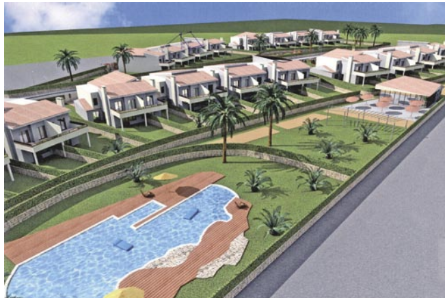
Proyecto de MAPFRE INMUEBLES en Bétera (Valencia)

En el ejercicio 2005 los ingresos por arrendamiento de los inmuebles gestionados por la entidad han ascendido a 64,3 millones de euros, con incremento del 6 por 100 sobre el ejercicio anterior y sus gastos de mantenimiento a 15,7 millones de euros. Las superficies en arrendamiento ascienden a un total de 370.507 metros cuadrados, cifra superior en un 2 por 100 a los 359.894 metros cuadrados gestionados en el ejercicio precedente.