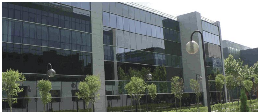
Edificio Isla de Hierro, 3. San Sebastián de los Reyes (Madrid)

En el ejercicio 2005 la sociedad aprobó un nuevo Plan Estratégico que contempla la realización de fuertes inversiones en compra de suelos, para configurar una cartera que permita producir