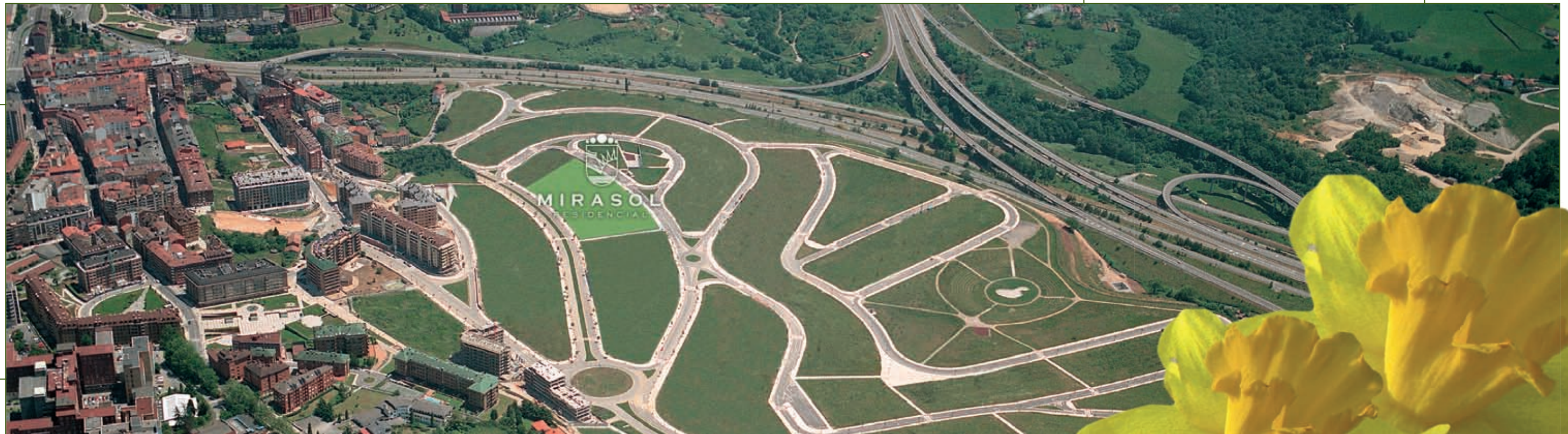
Vista aérea de la zona

Cuando se puede disfrutar así de un paisaje protegido de más de 50 km 2 , ¿quién se conforma con tener un parque al lado de casa?