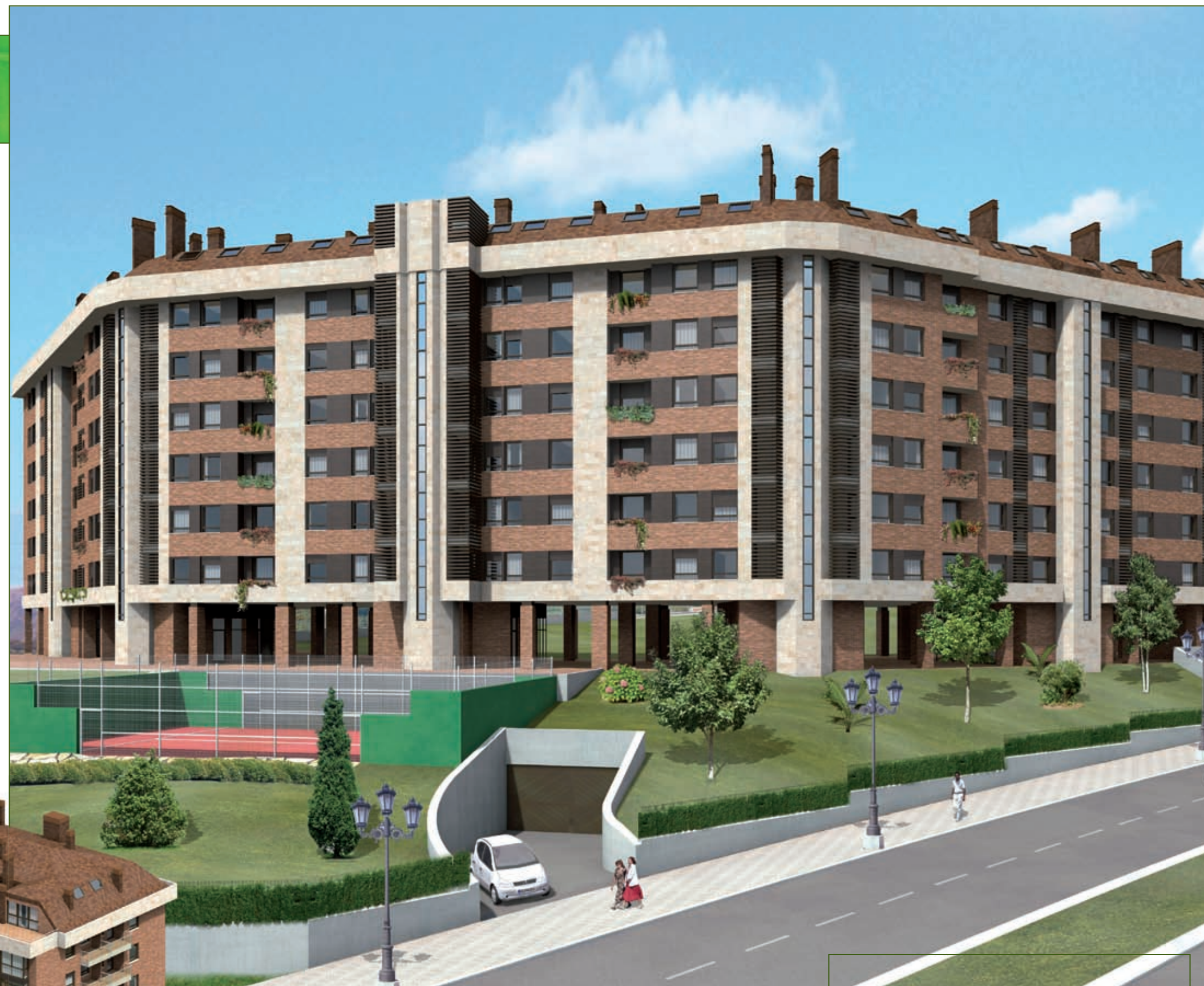
Vista Exterior, c/ PILOÑA

Como puede ver, en Mirasol encontrará ventajas y servicios para disfrutar día a día.