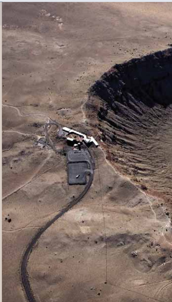
Cráter Barringer en Arizona. EEUU

En Don Quijote, "proponemos lanzar dos sondas, una primera para observar el asteroide, su mutación, movimiento, cómo es la superficie, su campo gravitatorio y luego una segunda sonda que llegue a mucha velocidad y choque con él, moviéndolo con el impacto. Presentamos esta idea en un concurso abierto en Europa donde estuvieron presentes grandes compañías y contra todo pronóstico ganamos y a partir de ahí es la misión de la ESA para luchar contra asteroides".