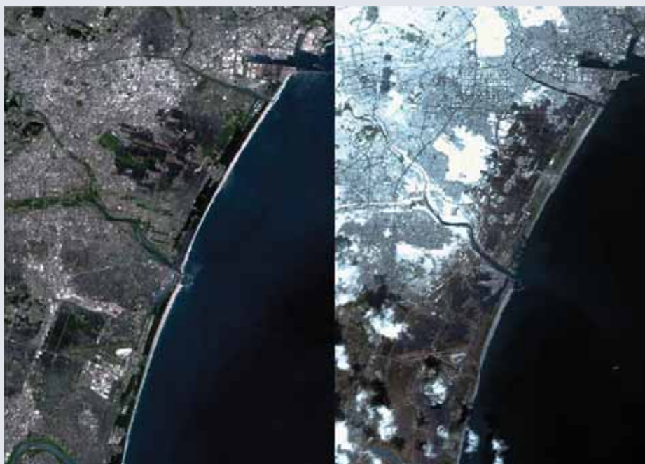
Efectos provocados [antes / después] por el tsunami de 2011 en la ciudad de Sendai, Japón