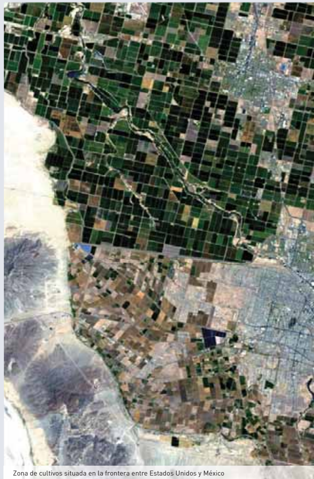
Zona de cultivos situada en la frontera entre Estados Unidos y México

La innovación en una empresa tecnológica es una condición sine qua non y como ejemplo te-