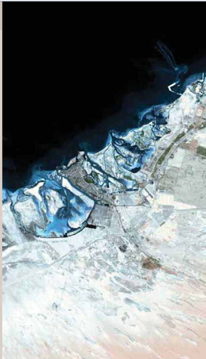
Emiratos Árabes Unidos

En 2013 está previsto el lanzamiento de un nuevo satélite: Deimos 2, con más resolución -400 veces más-, potencia y tamaño que su antecesor. Un "salto" muy importante, para Belló, "porque en 300 kilos nadie había puesto antes un metro de resolución y pensamos que es factible y funcionará muy bien". Además, hay otro aspecto revelador: el satélite se ha integrado en sus instalaciones de Puertollano, "dando un nuevo paso en la cadena de valor de observación de la Tierra".