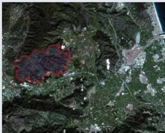
Área afectada por el incendio declarado en la zona de Benicolet, Valencia en 2011