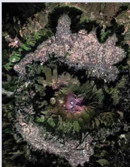
Volcán Nakadake y la ciudad de Aso, prefectura de Kumamoto, Japón

Elecnor Deimos se ha propuesto lograr un crecimiento continuo y sostenido y convertirse en una gran corporación multinacional antes de 2015. ¿En que punto se encuentran, actualmente, de este objetivo?