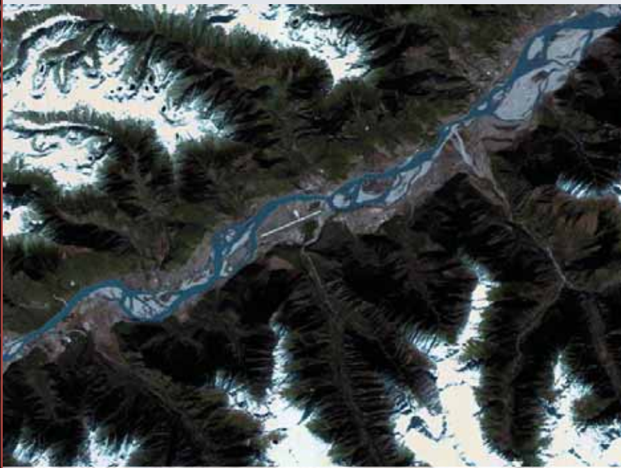
Cañón del río Yartlung Zangbo, Tíbet

Director General de Elecnor Deimos Madrid - España