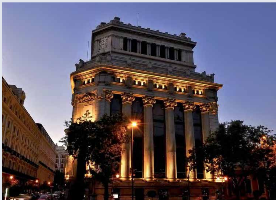
Sede Central del Instituto Cervantes. Madrid.

Su misión es plural, creativa, y abarca todas las disciplinas culturales. Además, intenta