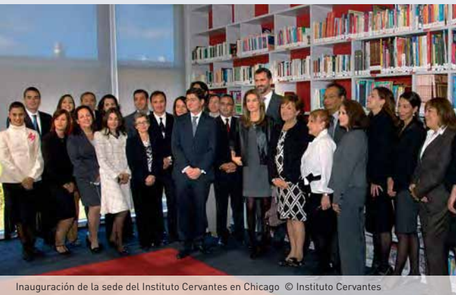
Inauguración de la sede del Instituto Cervantes en Chicago

“El español, como industria cultural, contribuye con un 15% a nuestro PIB”