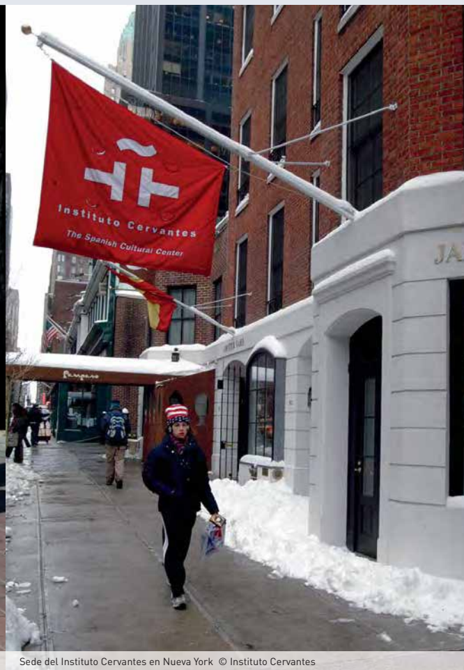
Sede del Instituto Cervantes en Nueva York