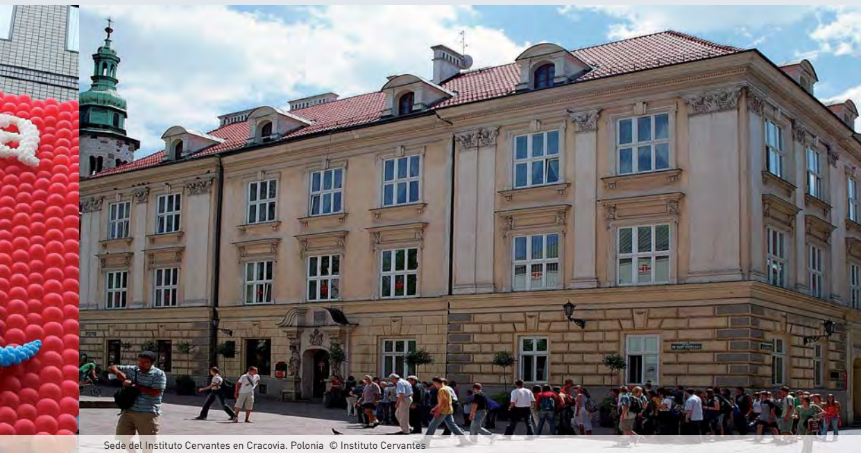
Sede del Instituto Cervantes en Cracovia, Polonia

olvidemos que la comunidad hispana incrementa su presencia, por lo que va ejerciendo más incidencia en el ámbito económico y político. Los datos del censo que nos proporciona EEUU están referidos a una investigación que se ha hecho en el año 2007, publicada en los dos años siguientes. La tasa de crecimiento del español en EEUU va a hacer que este sea el primer país hispanohablante, superando a México. Proyecciones realizadas recientemente indican que el 40% de los jóvenes en 2050 tendrá origen hispano. Casi podemos decir que ese continente hablará español de norte a sur.