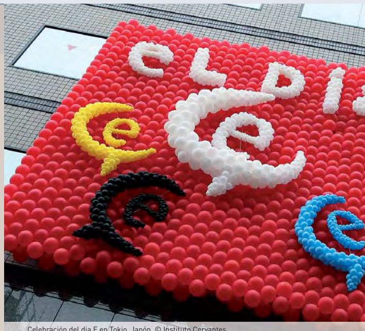
Celebración del día E en Tokio. Japón

de usuarios, pero esto se debe a la llamada "brecha digital". Si todos los hablantes de español tuvieran acceso a Internet, se dispararía. Por detrás del español se sitúan el japonés, con un 5,6%; el francés, con un 4,6%; y el alemán, con un 4,4%.