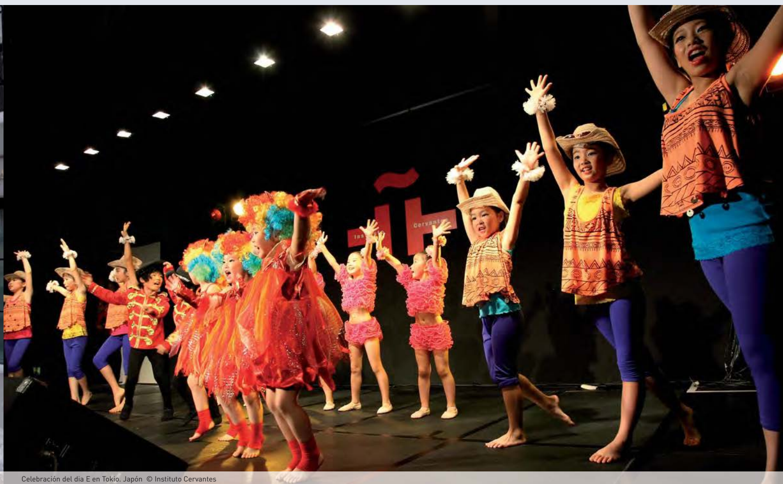
Celebración del día E en Tokio, Japón

dad en el ámbito de la cultura, y no sólo hablamos de literatura. Trabajamos con todas las embajadas de América Latina, lo que nos permite una gran proyección frente a otras instituciones similares, como por ejemplo el Instituto Goethe, que sólo trabaja la cultura alemana, aunque podría incluir la austriaca.