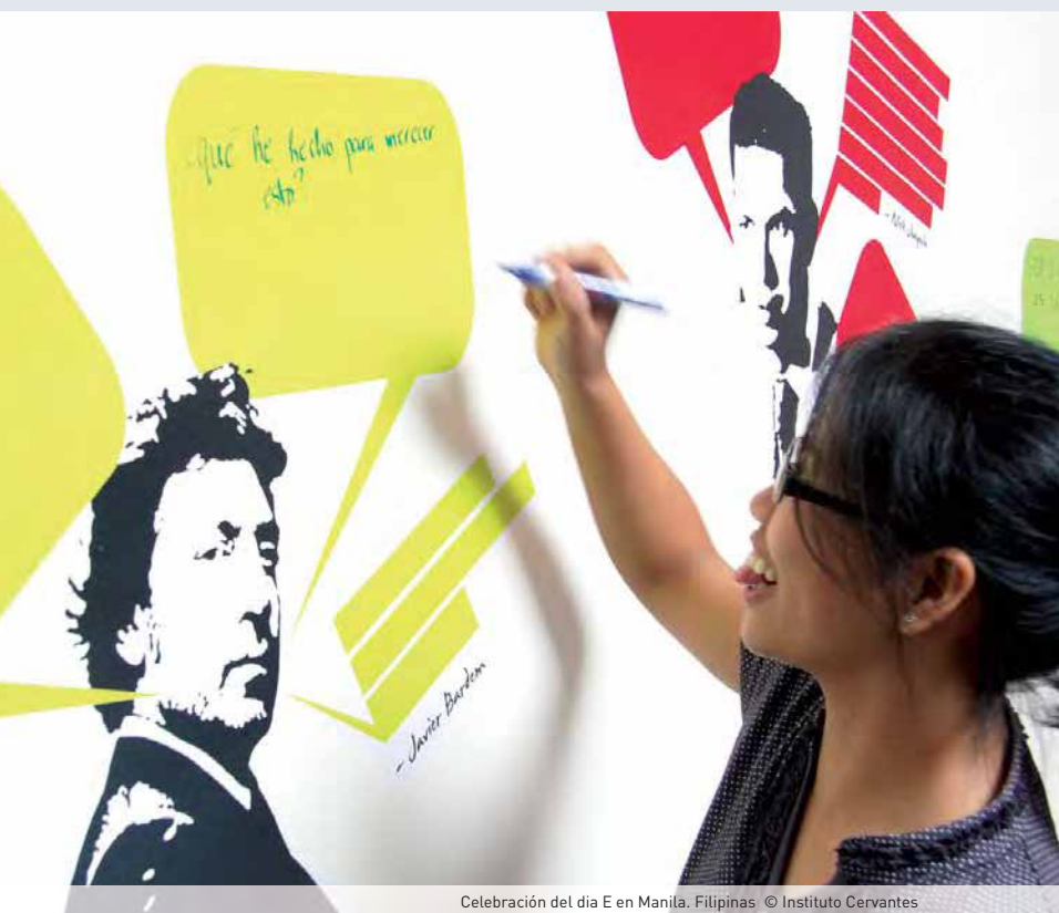
Celebración del día E en Manila, Filipinas.

notando que los jóvenes cada vez eligen más el español. Con todo tipo de matices, creo que, efectivamente, el español está siendo la lengua de estudio más elegida después del inglés.