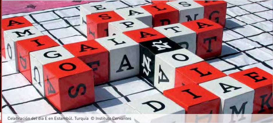
Celebración del día E en Estambul, Turquía