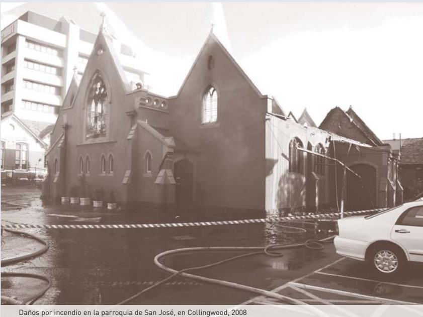
Daños por incendio en la parroquia de San José, en Collingwood, 2008