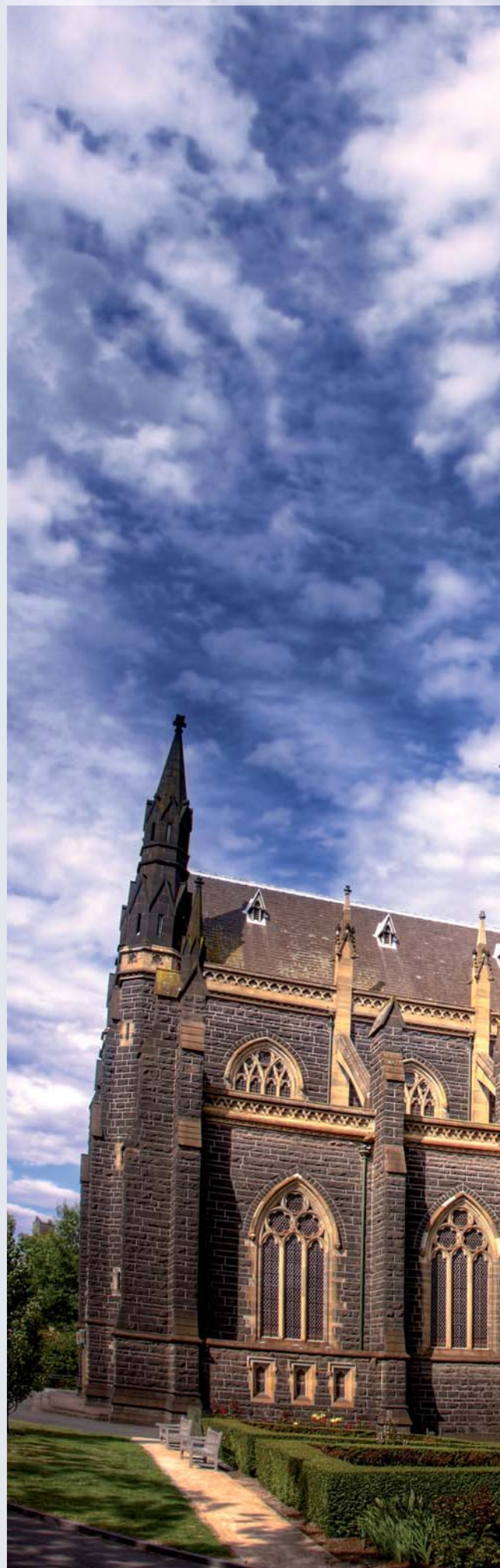
Catedral de San Patricio, Melbourne

El Vaticano no ofrece asistencia en este ámbito a nivel mundial. Por regla general, cada diócesis y cada congregación religiosa es indepen-