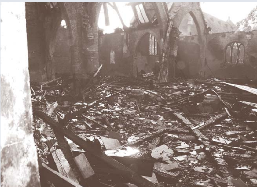
Daños por incendio en la parroquia de San José, en Collingwood, 2008