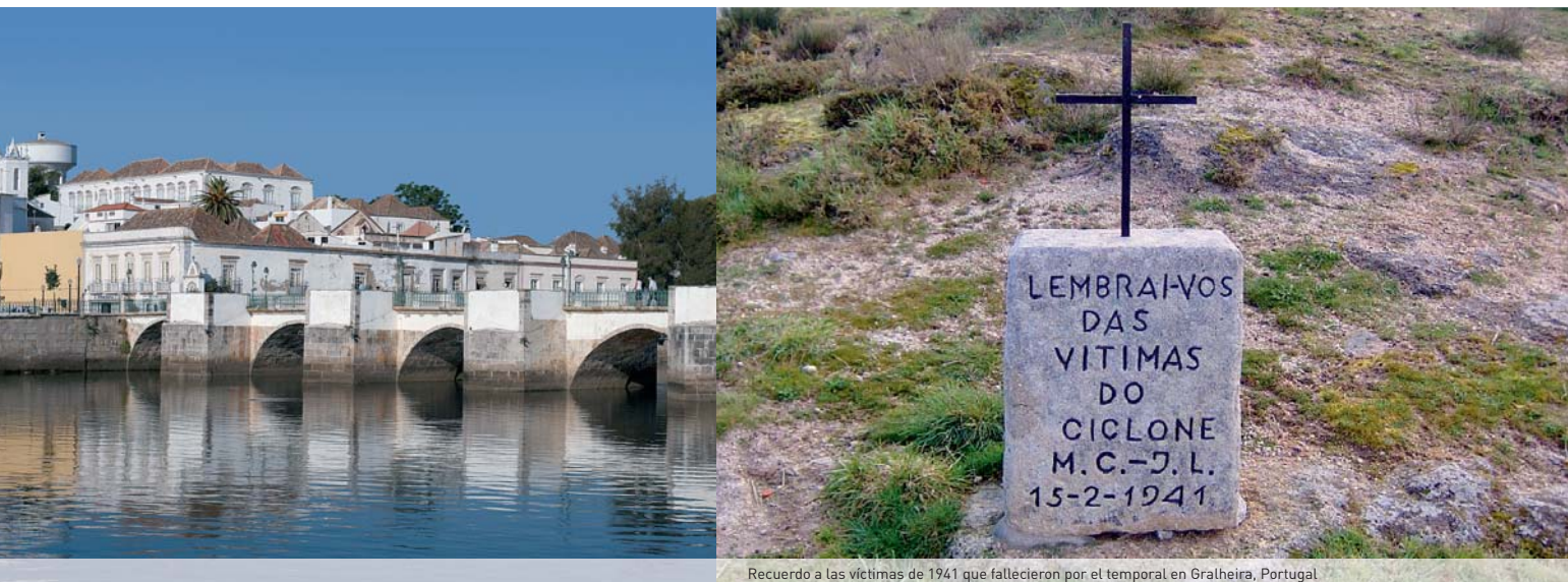
Recuerdo a las víctimas de 1941 que fallecieron por el temporal en Galheira, Portugal

ción de Santander), la cifra estaría entre 1.000 y 1.500 millones de EUR en 2009.