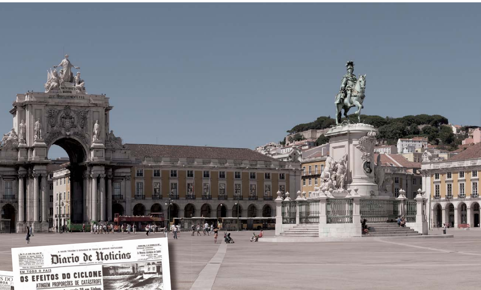
Plaza del Comercio, Lisboa