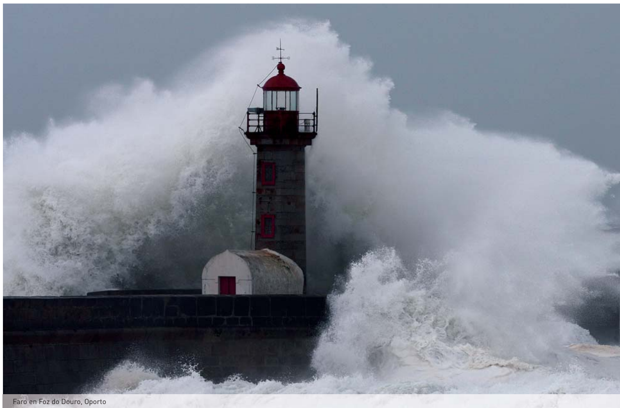
Faro en Foz do Douro, Oporto

¿Qué ocurre cuando el principal centro de bajas presiones “islandés” se sitúa más al sur?