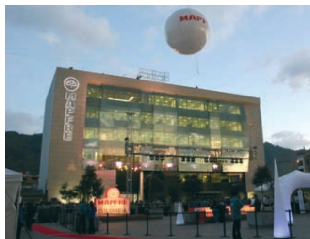
INAUGURACIÓN DE LA NUEVA SEDE DE MAPFRE COLOMBIA EN BOGOTÁ

Además, se han iniciado las operaciones de seguro directo en Ecuador a través de una agencia de seguros propiedad de MAPFRE COLOMBIA, aprovechando las posibilidades que brinda el Pacto Andino.