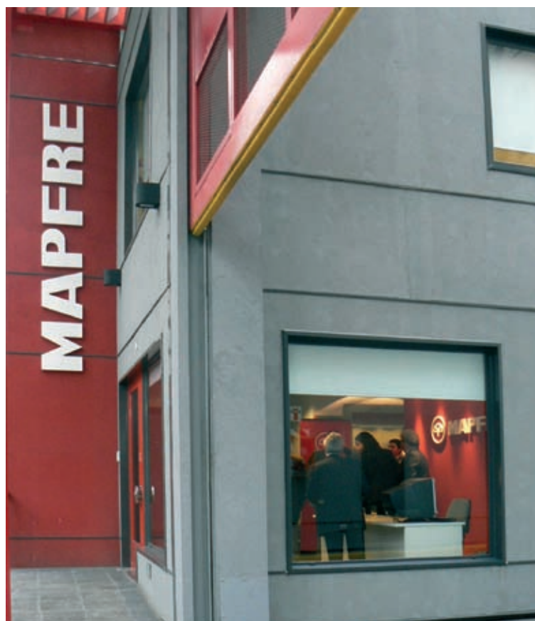
SERVICENTRO EN ARGENTINA

Al mismo tiempo, se siguen consolidando importantes avances estructurales en las principales economías latinoamericanas, tales como significativas mejoras en las cifras de déficit público, aumento de los superávits comerciales con el exterior y en cuenta corriente (aunque con fuertes diferenciales entre países), mejora en los niveles de solvencia y supervisión de los sistemas financieros, etc.