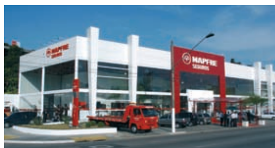
NUOVO CENTRO DE MAPFRE BRASIL