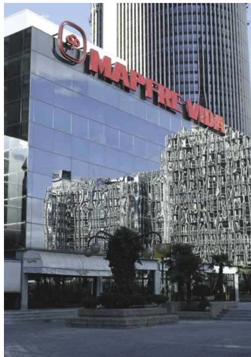
Sede de MAPFRE VIDA. General Perón, 40. Madrid

El patrimonio de los Fondos de Pensiones se ha situado en 1.287 millones de euros, con un crecimiento del 24,3 por 100, de los que 1.136 millones corresponden al sistema individual. El número de partícipes ha alcanzado la cifra de 142.807, de los que 132.431 pertenecen al sistema individual. Durante este ejercicio se han incorporado los planes Servirenta y Servirenta II procedentes de MUSINI.