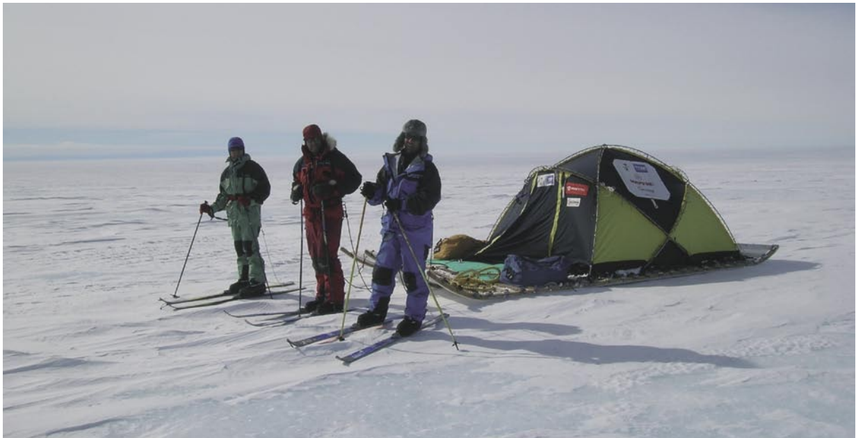
MAPFRE patrocinó "La Gran Travesía de la Antártida"

En este contexto de buenos resultados corporativos y de incremento de la renta disponible, cabe prever un desarrollo muy positivo de los productos aseguradores. Por otra parte, todo hace pensar que se mantendrá el buen comportamiento de los mercados financieros en el próximo ejercicio, favoreciendo a los productos vinculados a los mercados bursátiles. Asimismo cabe esperar una cierta recuperación de los niveles de tipos de interés, que permitirá un incremento significativo en la venta del Seguro de Vida, si bien su evolución se verá condicionada también por el tratamiento fiscal del ahorro que se establezca en la nueva Ley del Impuesto sobre la Renta de las Personas Físicas remitida por el gobierno a las Cortes en fecha reciente. El dinamismo de los diferentes sectores de nuestra economía se traducirá en un clima favorable para el desarrollo de las diferentes empresas que integran el SISTEMA MAPFRE.