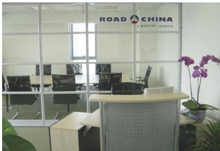
Oficinas de MAPFRE en China