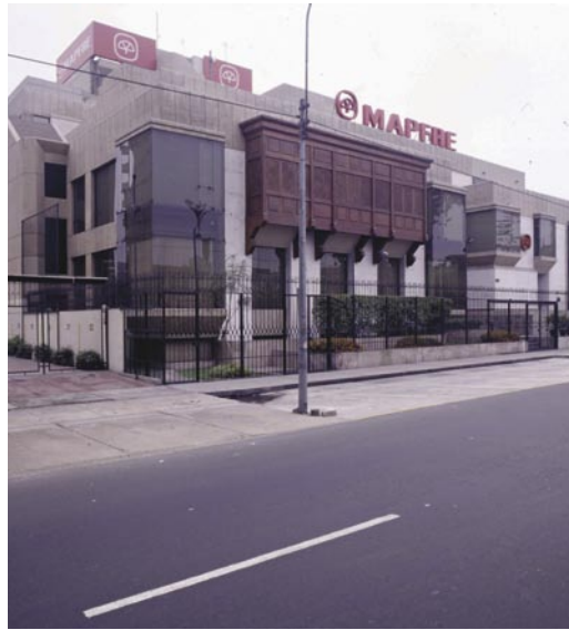
Edificio de MAPFRE PERÚ

Durante 2005 ha continuado el proceso de consolidación del mercado en Brasil, destacando las adquisiciones de HSBC Seguros por HDI Seguros, de Real Seguros por Tokio Marine Nichido, y de NOSSA CAIXA en la que MAPFRE VERA CRUZ ha tomado una participación del 51 por 100