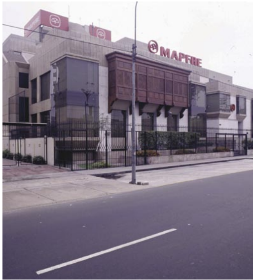
Edificio de MAPFRE PERÚ

Durante 2005 ha continuado el proceso de consolidación del mercado en Brasil, destacando las adquisiciones de HSBC Seguros por HDI Seguros, de Real Seguros por Tokio Marine Nichido, y de NOSSA CAIXA en la que MAPFRE VERA CRUZ ha tomado una participación del 51 por 100