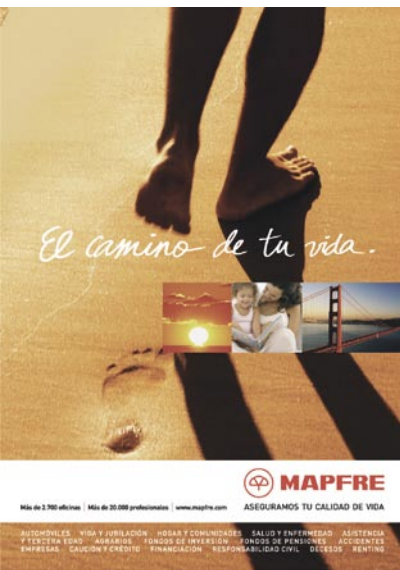
Campaña de publicidad "El camino de tu vida"

Las cuentas anuales del Sistema y de las principales sociedades que lo integran correspondientes al ejercicio 2005 han sido auditadas por la firma Ernst & Young, a excepción de las entidades ubicadas en El Salvador cuyo auditor es KPMG. Las retribuciones devengadas a favor de los Auditores Externos en el mencionado ejercicio por los servicios correspondientes a la auditoría de cuentas anuales ascienden a 3.497.306 euros, de los cuales 3.477.386 corresponden al auditor principal. También se han devengado por el auditor principal 468.898 euros por servicios