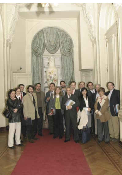
Visita de periodistas españoles a Argentina y Brasil

Las actuaciones más reseñables de mejora en el soporte a la Red MAPFRE se han centrado en la renovación de puestos y equipos, en nuevas dotaciones para oficinas y para el nuevo centro de la Línea MAPFRE Autos en Ávila. Se han convertido 346 PCWebs de Oficinas a PDM's (Plataformas Delegados MAPFRE), y se han instalado 223 nuevas oficinas delegadas con PDM y 562 nuevos puestos PDM en oficinas ya existentes. La plataforma PDM ha quedado finalmente con 1.820 oficinas y 3.553 puestos de trabajo.