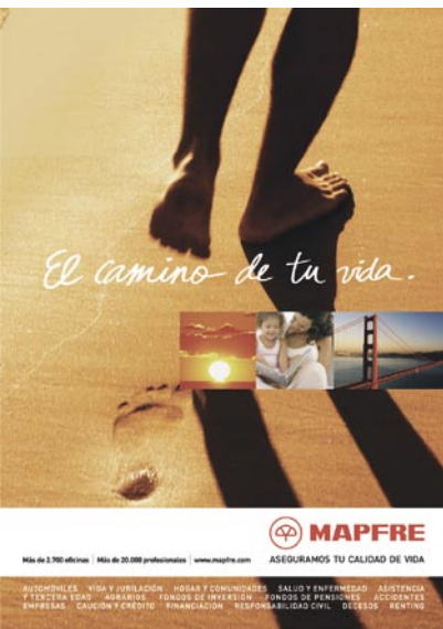
Campaña de publicidad "El camino de tu vida"

Las cuentas anuales del Sistema y de las principales sociedades que lo integran correspondientes al ejercicio 2005 han sido auditadas por la firma Ernst & Young, a excepción de las entidades ubicadas en El Salvador cuyo auditor es KPMG. Las retribuciones devengadas a favor de los Auditores Externos en el mencionado ejercicio por los servicios correspondientes a la auditoría de cuentas anuales ascienden a 3.497.306 euros, de los cuales 3.477.386 corresponden al auditor principal. También se han devengado por el auditor principal 468.898 euros por servicios