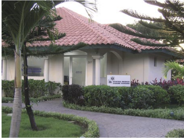
Clínica Caribe Bávaro (República Dominicana)

A lo largo de 2005 se ha incrementado significativamente la colaboración recíproca entre MAPFRE y CAJAMADRID para competir más eficientemente en el mercado