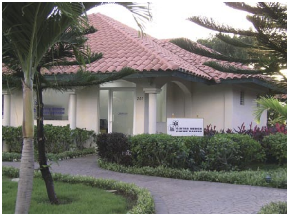
Clínica Caribe Bávaro (República Dominicana)

A lo largo de 2005 se ha incrementado significativamente la colaboración recíproca entre MAPFRE y CAJAMADRID para competir más eficientemente en el mercado