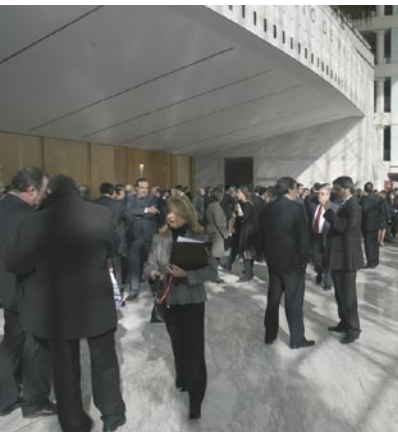
Asistentes a las Juntas Generales 2005