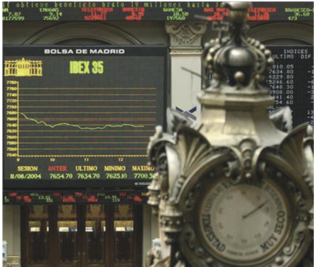
Interior de La Bolsa