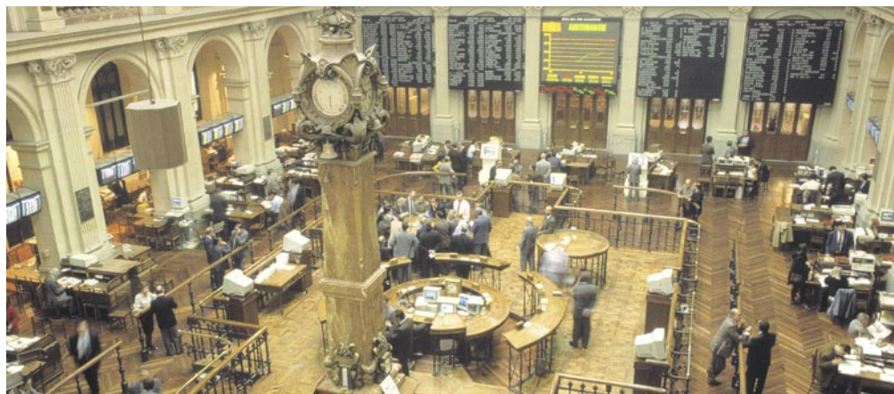
Interior del edificio de la Bolsa en Madrid