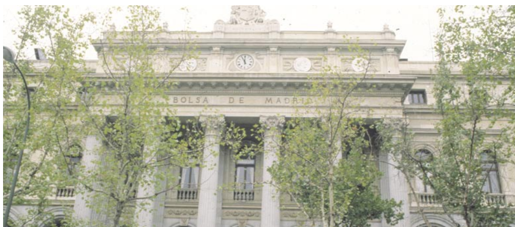
Edificio de la Bolsa en Madrid