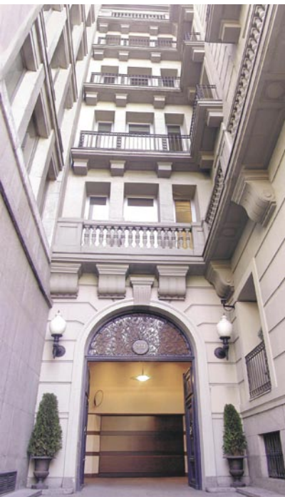
Sede de MAPFRE CAJA SALUD en el Paseo de Recoletos, 29, en Madrid