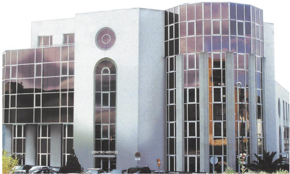
Centro médico de la calle Lezama en Madrid