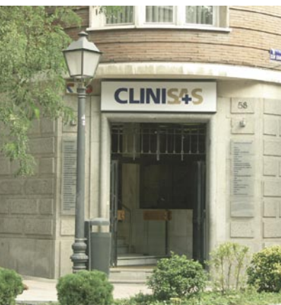
Centro Médico CLINISAS (Madrid)

El volumen de ingresos por prestaciones sanitarias de esta sociedad ha sido de 5,5 millones de euros.