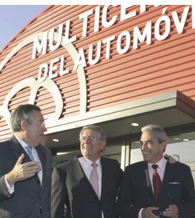
Inauguración de MAPFRE MULTICENTRO DEL AUTOMÓVIL en Alcalá de Henares (Madrid)

Además, se han impartido cinco cursos de formación en CESVIMAP, para los conductores y propietarios de grúas, relacionados con aspectos técnicos y metodológicos de la asistencia en carretera y de la calidad y atención a clientes, a los que han asistido un total de 100 personas.