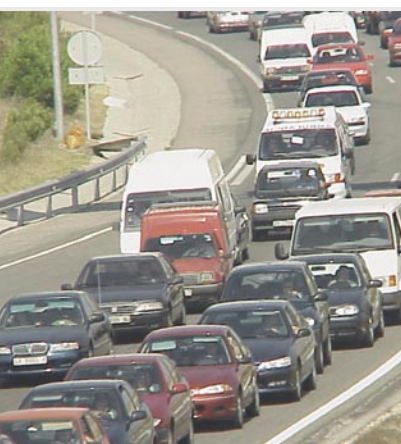
MAPFRE MUTUALIDAD cuenta con una cartera de 5.175.832 pólizas de automóviles

Se está llevando a cabo también una profunda revisión de los sistemas informacionales para la toma de decisión, orientándose a entornos de Business Intelligence lo que aportará importantes mejoras en el ámbito de la gestión, que permitirá optimizar y simplificar la gestión operativa. Igualmente supondrá un avance importante en el nuevo esquema de soporte a la gestión, con importante simplificación y ahorros de costes y recursos dedicados.