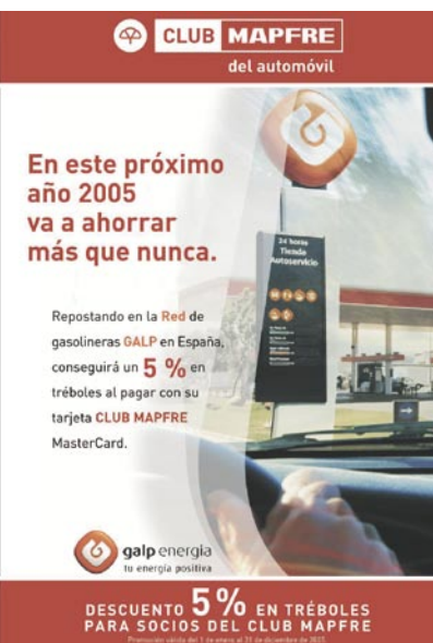
Anuncio Ahorro en el 2005

El negativo marco económico existente en Portugal ha condicionado un año más el desarrollo del sector asegurador, especialmente en los ramos No Vida, lo que ha configurado un nuevo año adverso a tenor del insignificante crecimiento previsto que, según estimaciones de la Associação Portuguesa de Seguradores, se situará entorno al 2 por 100, inferior a la inflación.