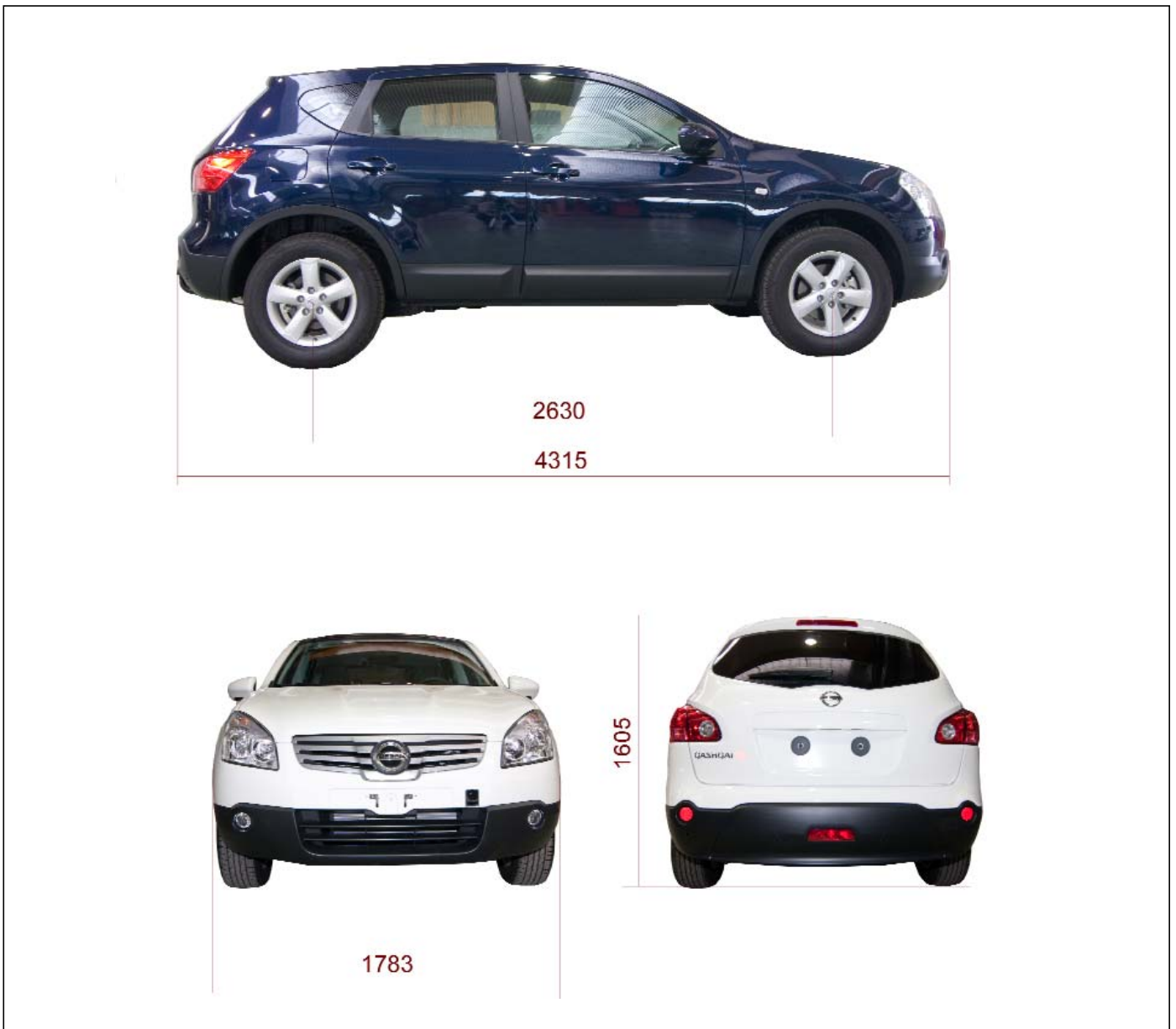
Figura 2.- Dimensiones exteriores del vehículo