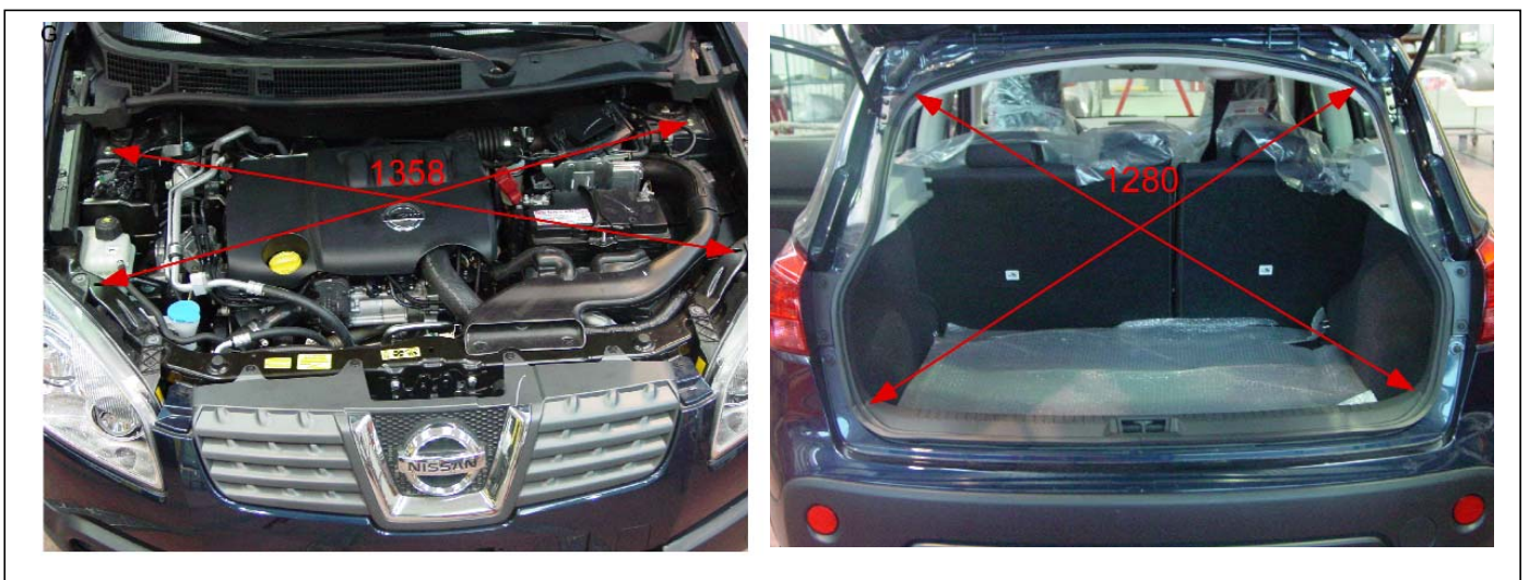
Figura 3.- Cotas de la parte delantera y trasera