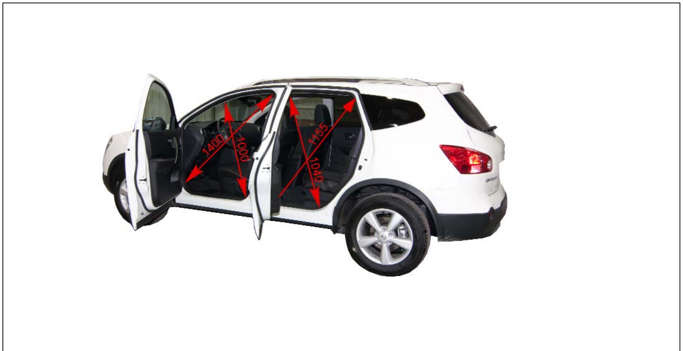
Figura 4.- Medidas de los huecos de puertas